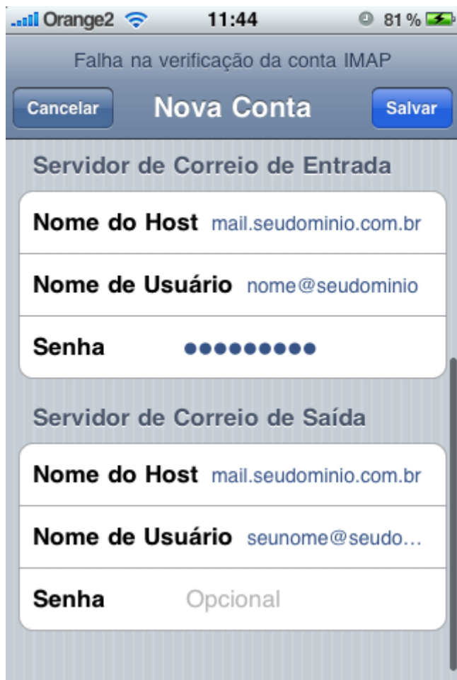
Passo 7 - iPhone

Passo 7 -> Selecione conta IMAP '. Entre com o nome do Host mail.seudominio.com.br em ambos servidores de Entrada e Saída , seu nome e senha e aperte Salvar . A senha deve ser inserida tanto no servidor de entrada quanto no de saída, apesar de aparecer Opcional no iPhone.