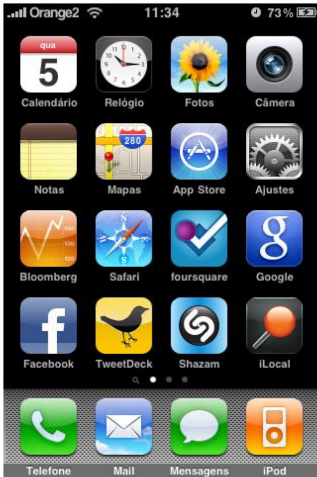
Passo 1 – iPhone